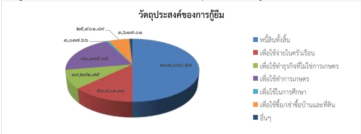
แผนภูมิที่ ๒.๒ แสดงหนี้สินเฉลี่ยต่อครัวเรือน จำแนกตามวัตถุประสงค์ของการกู้ยืม พ.ศ. ๒๕๖๓